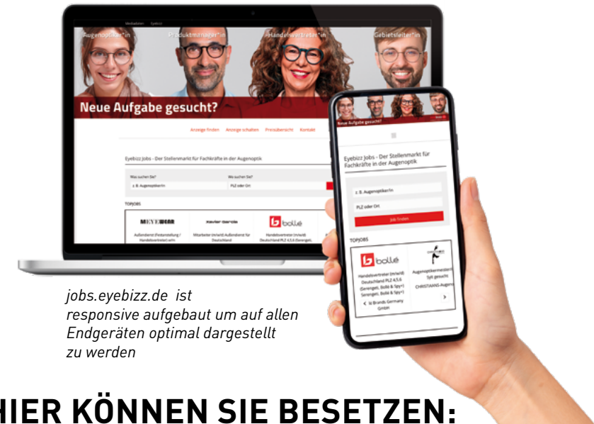
jobs.eyebizz.de ist responsive aufgebaut um auf allen Endgeräten optimal dargestellt zu werden

Der Eyebizz Buzzer ist exklusiv für Augenoptiker zu einem sensationellen Einführungspreis von 490 Euro erhältlich.