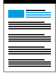
Beispiel: Native Text Ad