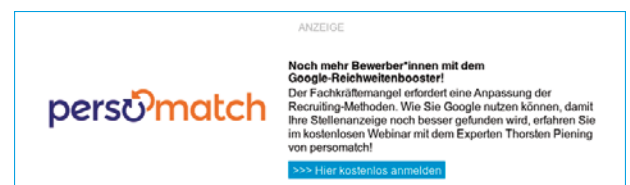
Beispiel: Native Text Ad